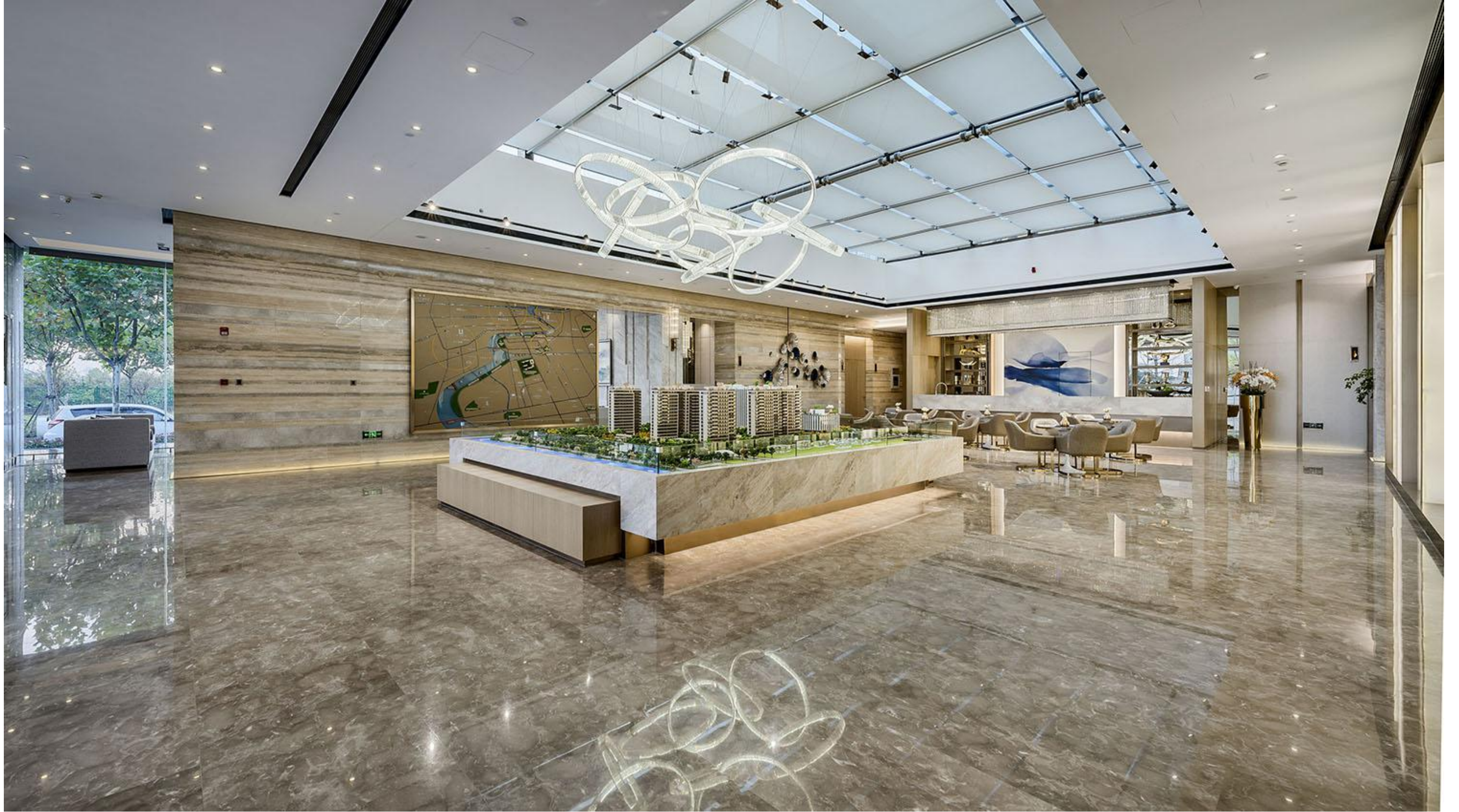
這是一個改造專案，這原本是一個住宅社區內的公共空間，現在改建成了一個展示中心，用來接待顧客，感受一種新型的公共建築空間。目標是打破室內室外的界限，形成一個室內和室外融合的空間。