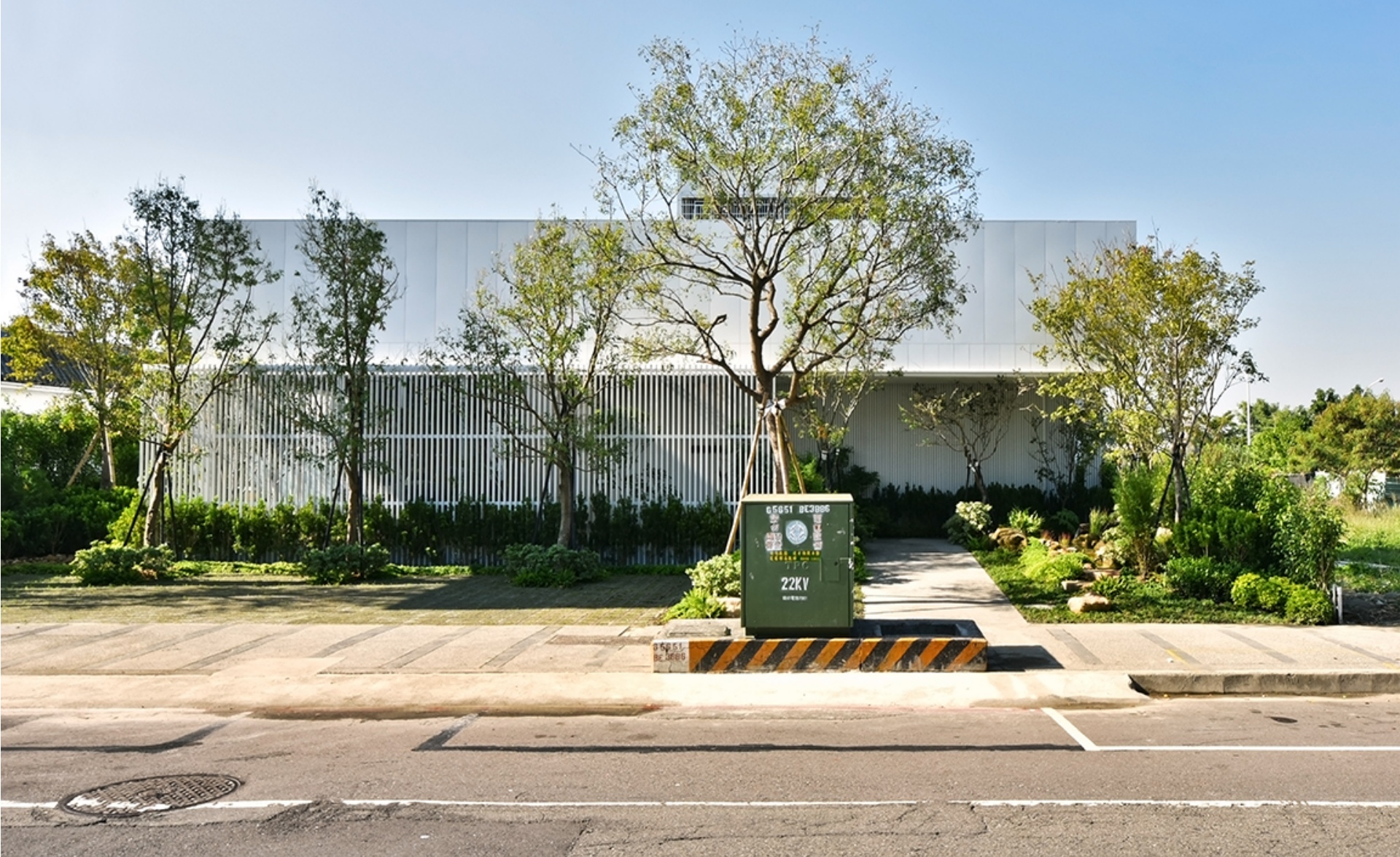
鄉間院落·院外樹景綠意·小橋流水生機·光透燦爛間·光影如流洩碎玉·灑落於農家之樂。