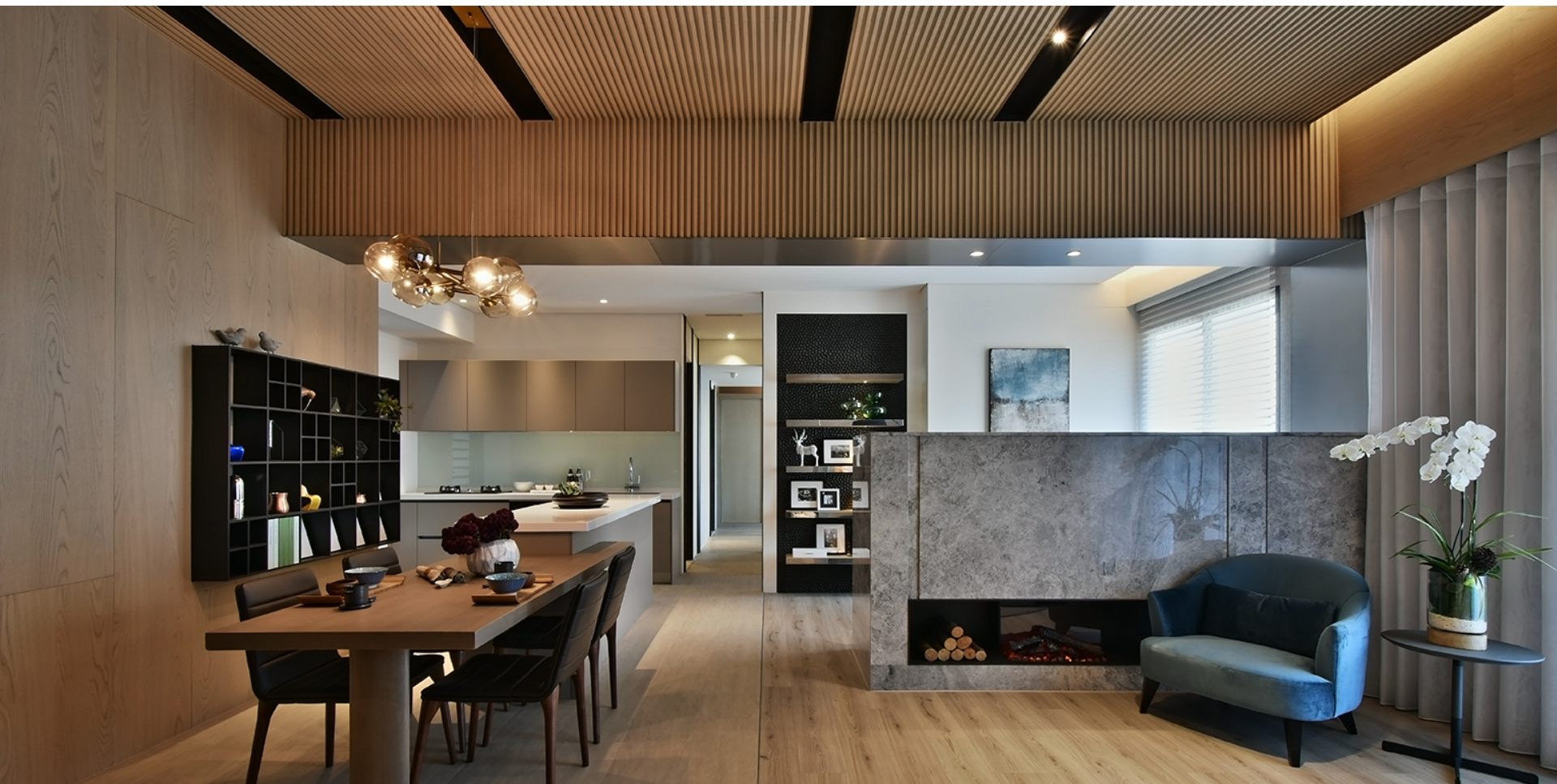
雲灰紋石材鋪陳的電視矮牆面，導入壁爐元素燈源營造溫馨。電視矮牆另一面為書房，將開放空間與閱讀空間作出簡約雙結合。