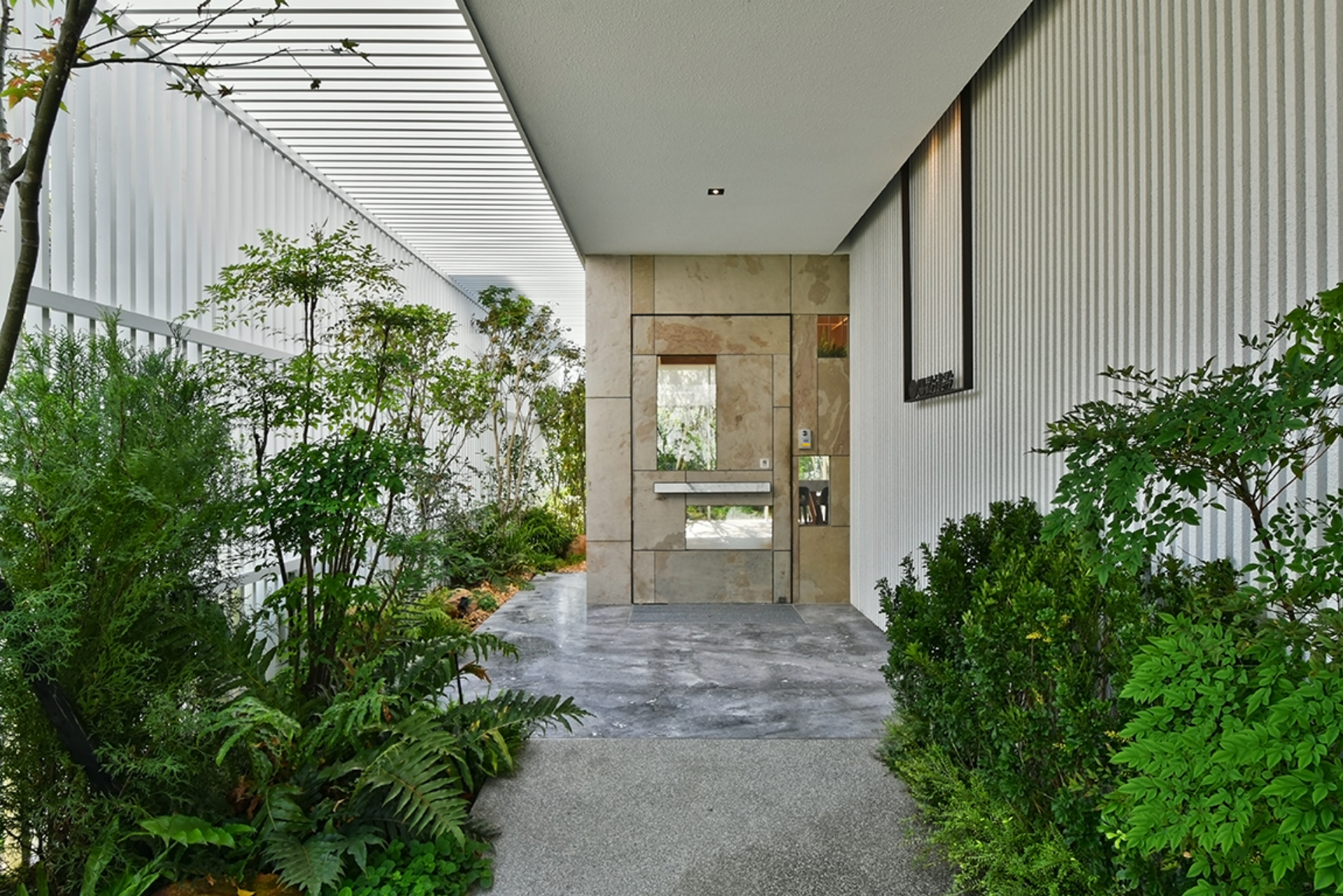
接待會館外牆皮層有三，表層為白色格柵，隔絕車馬喧擾視覺，並保持光透質。中為植栽綠意，透過內層玻璃引景入室