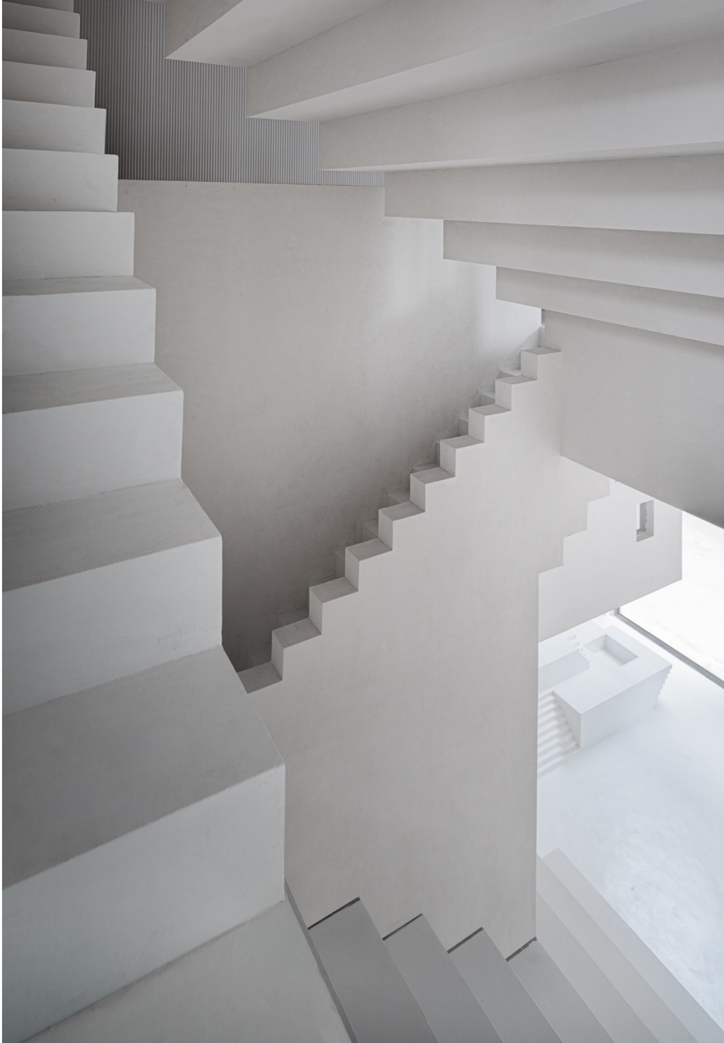
俯看阶梯休息区+一层前台区